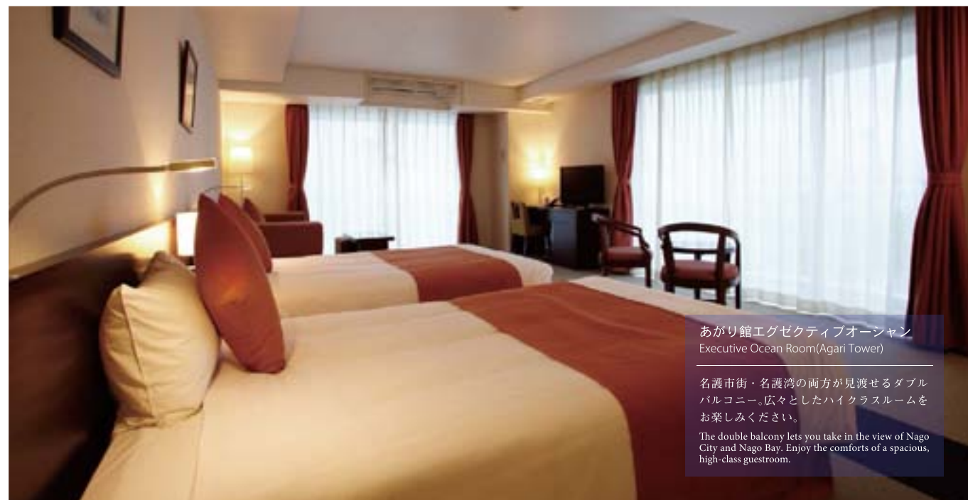
あがり館エグゼクティブオーシャン Executive Ocean Room(Agari Tower) 名護市街・名護湾の両方が見渡せるダブル バルコニー。広々としたハイクラスルームを お楽しみください。 The double balcony lets you take in the view of Nago City and Nago Bay. Enjoy the comforts of a spacious, high-class guestroom.