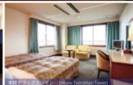
本館デラックスツイン Deluxe Twin(Main Tower)

Great selections! That is the benefit of choosing to stay with us. Maeda Sangyo Hotels offers convenience that meets the needs of our guests, depending on their visit objectives and the areas.