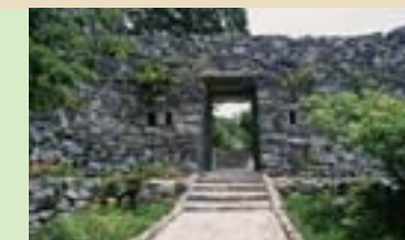
今帰仁城跡 Nakijin Castle Ruins 琉球三山時代の北山王の居城跡。首里城同等の面積を誇る標高約100mの沖縄屈指の名城。 A gusuku castle site which was once home to the King of Hokuzan during the Sanzan period in the Ryukyu Kingdom era. It boasts an area as vast as Shurijo Castle and stands at an altitude of 100 meters. It is one of the most famous castle sites in Okinawa.