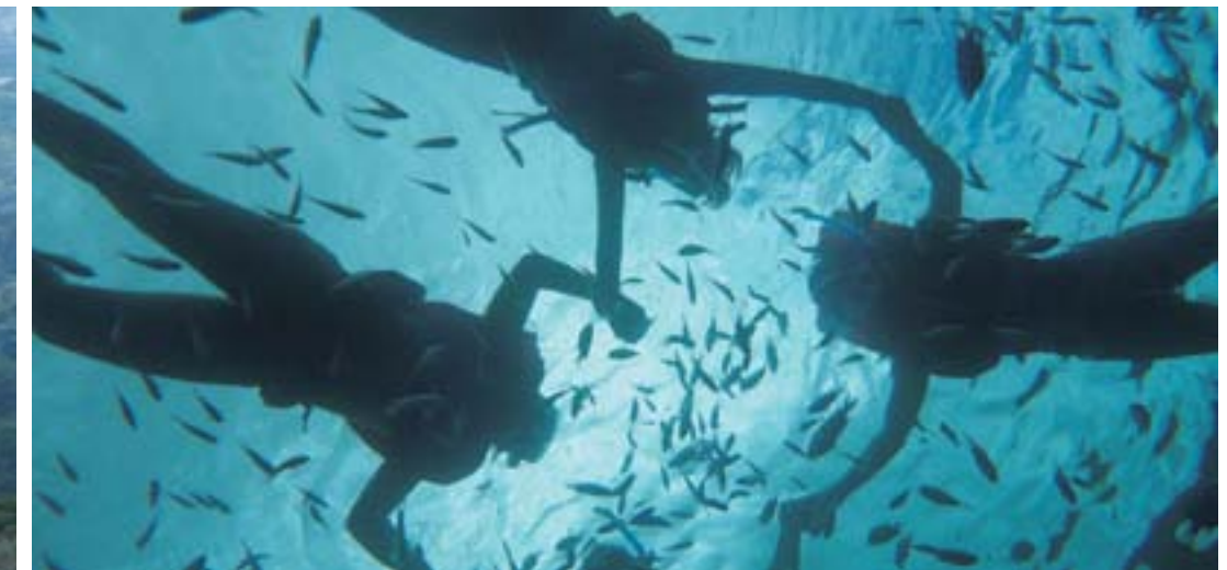
体験ダイビング Introductory Diving やんばるにはたくさんの素晴らしいダイビングスポットがあります。 There are many wonderful diving spots in Yanbaru.