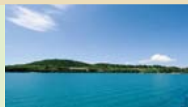
瀬底島 Sesoko Island

Kouri Island is an island with a circumference of approximately 8km. It can be reached from Yagaji Island in Nago City over the Kouri Ohashi Bridge. The beauty of the waters surrounding this tiny island is spectacular and attracts visitors all year round.