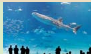
沖縄美ら海水族館 Okinawa Churaumi Aquarium 全長8.4mのジンベエザメやマンタが泳ぐ世界最大級の水槽など、大きな感動に出会える。 An awe-inspiring aquarium renowned for its world-class tank that displays a number of manta rays and whale sharks that are as big as 8.4 meters in length.