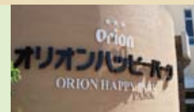
オリオンハッピーパーク Orion Happy Park

From the strait under the Warumi Bridge, the waters lead to the Haneji inland sea. Enjoy the panoramic views of nature on a sea kayak.