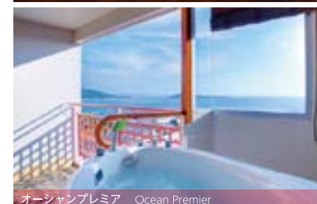
オーシャンプレミア Ocean Premier