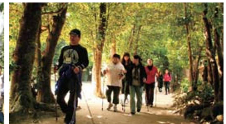
ノルディックウォーキング（本部町） Nordic Walking (Motobu Town) 南国の亜熱帯植物を観察しながらのコース。サンセットタイムには水納島、伊江島、瀬底島の、まるで絵画のような美しい景観を楽しむ事ができます。 The course invites the participants to observe the flora of the southern subtropics. The beautiful scenery overlooking the islands of Minna, Ie, and Sesoko during the picturesque sunsets is simply breathtaking.