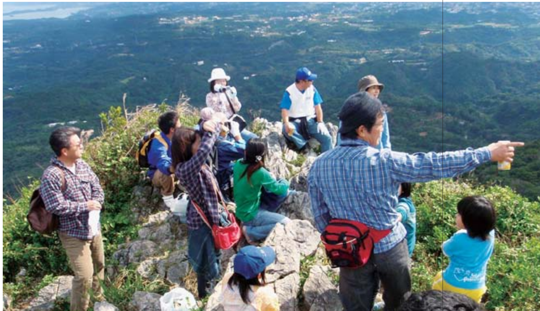
トレッキングツアー（嘉津宇岳） Trekking Tour (Katsudake) 名護市内にある標高 452m の嘉津宇岳。山頂を目指してのトレッキングツアーです。頂上からの 360 度広がるパノラマはまさに絶景。 Katsudake is located within the city of Nago, and has an altitude of 452 meters. The tour leads the group to the summit where the trekkers are rewarded with a spectacular, panoramic view.