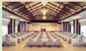
万国津梁館 Bankoku Shinryokan 2000年の九州・沖縄サミットの会場。国際会議・学会・ウェディングが行われるMICE施設。 The venue for the 2000 Kyushu-Okinawa G8 Summit. A MICE facility for international conferences, academic meetings, and weddings.

沖縄本島北部“やんばる”には 人気の観光スポットが数多く点在しています。 名護市・本部町に位置する 前田産業ホテルズならアクセスも快適です。