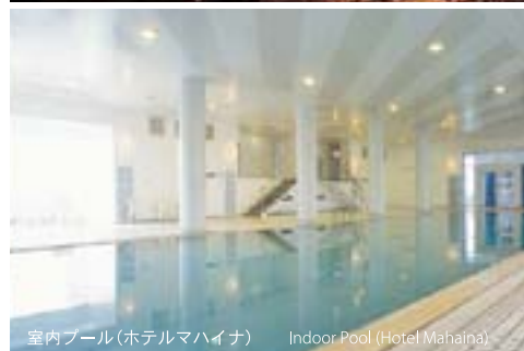
室内プール(ホテルマハイナ) Indoor Pool (Hotel Mahaina)