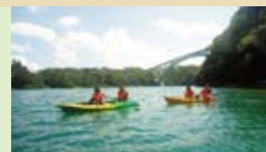
ワルミ海峡 Warumi Strait

The island offers breathtaking views from Sesoko Beach with its brilliantly white sand. Kick back and enjoy the sun set over Ie and Minna Islands, or take in the glitter of the stars that span across the evening skies.