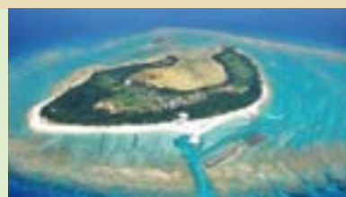
水納島 Minna Island

渡久地港より高速船で15分。マリンスポーツが存分に楽しめる三日月型のリゾート島。