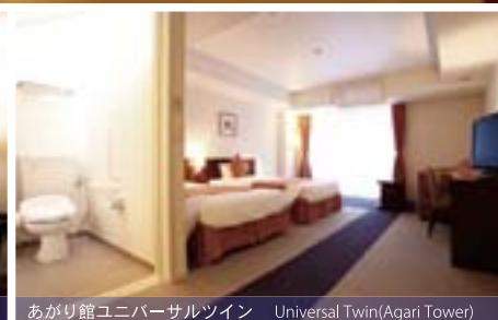
あがり館ユニバーサルツイン Universal Twin(Agari Tower)