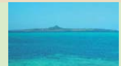
伊江島 Ie Island 本部港からフェリーで30分。タッチュー（城山）やハイビスカス園など見どころ多彩。 Only a 30-minute ferry ride away from Motobu Port. The Ie island offers a variety of beautiful sights.