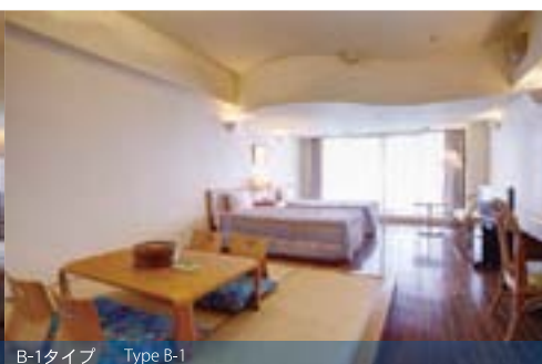
B-1タイプ Type B-1