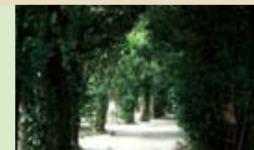
備瀬のフクギ並木 Fukugi Trees of Bise 昔ながらの備瀬の集落を風や潮から守る数千年ものフクギ並木。これぞ沖縄の原風景。 The narrow roads in the community of Bise are lined with several thousand fukugi trees (Garcinia subelliptica). These trees have been planted and growing in Bise since long ago, protecting the residents and their homes from the wind and the effects of the sea. Bise offers a glimpse into Okinawa's past.