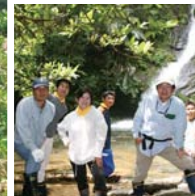
滝散策（名護市） Waterfall Trek (Nago City) やんばるの森には滝やトレッキングコースがいっぱい！新鮮な空気と植物に癒されます。 Many waterfalls in the forests of Yanbaru and are accessible by many trekking courses. Let the fresh air and rich vegetation recharge you!