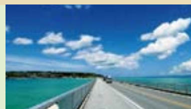
古宇利島 Kouri Island

Just 15 minutes by speed-boat from the Toguchi Port. The crescent moon-shaped resort island offers a great number of marine activities.