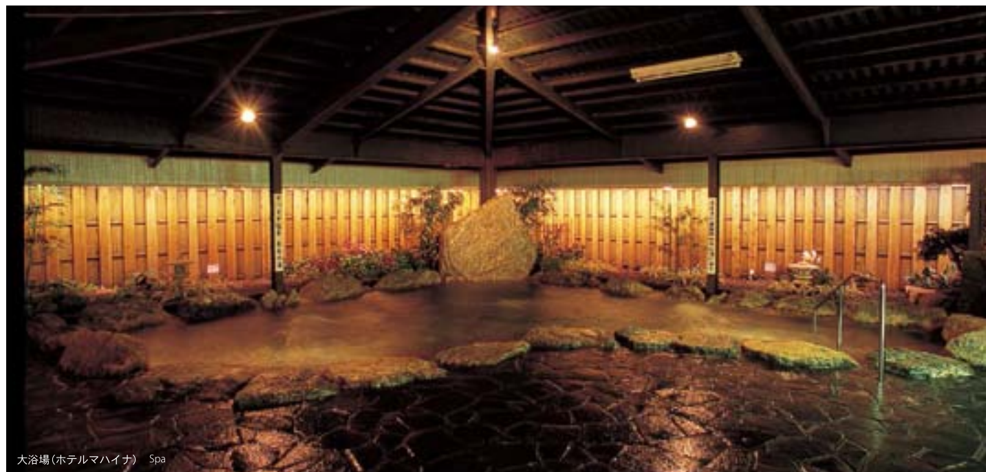
大浴場(ホテルマハイナ) Spa

Pamper yourself at Mahaina Hot Springs for the ultimate in relaxation. The mineral-rich waters nurtured by the coral reefs and our lineup of spa treatments will orchestrate a session of exquisite harmony.