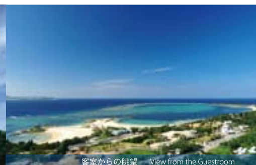
客室からの眺望 View from the Guestroom