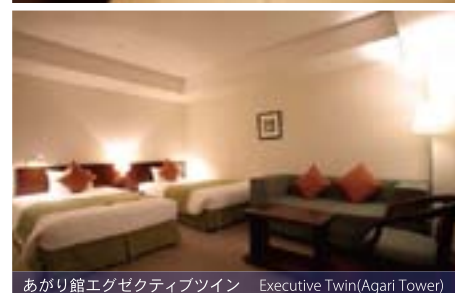
あがり館エグゼクティブツイン Executive Twin(Agari Tower)