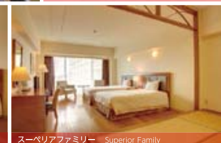
スーペリアファミリー Superior Family