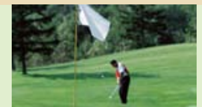
ゴルフ場 Golf Courses

Orion Beer is a local brand of beer that the Okinawans are proud of. The brewery offers tours and lets visitors see how the famous Orion Beer is made. At the end of the tour, you can enjoy fresh beer and the facility also offers delicious, seasonal gourmet.